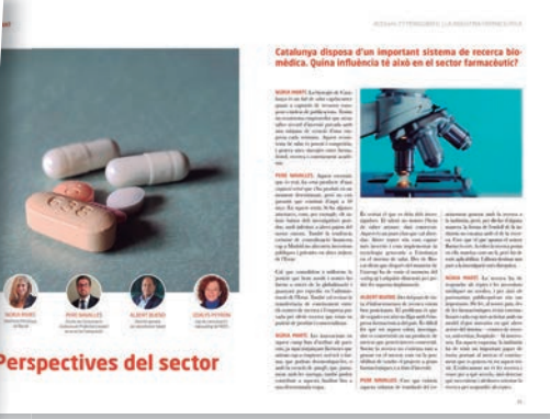
ACESInfo 77 - Monográfico. La indústria farmacèutica